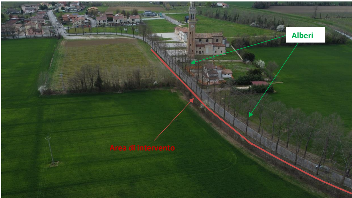
Figura 3. Filare di alberi lungo Via 4 Novembre – SP133, a ridosso dell'area di intervento

Relazione tecnica generale – Perizia di Variante n.1