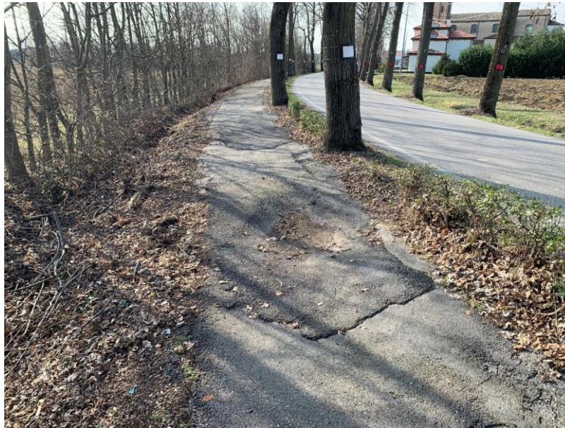
Figura 4. Avvallamenti e cedimenti del manto di copertura

Si elencano di seguito gli aspetti principali delle circostanze intervenute che hanno determinato la necessità della redazione della presente perizia: