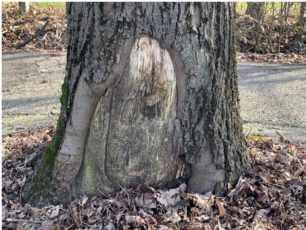
Figura 4. Grave lesione al colletto con legno degradato e marcescente