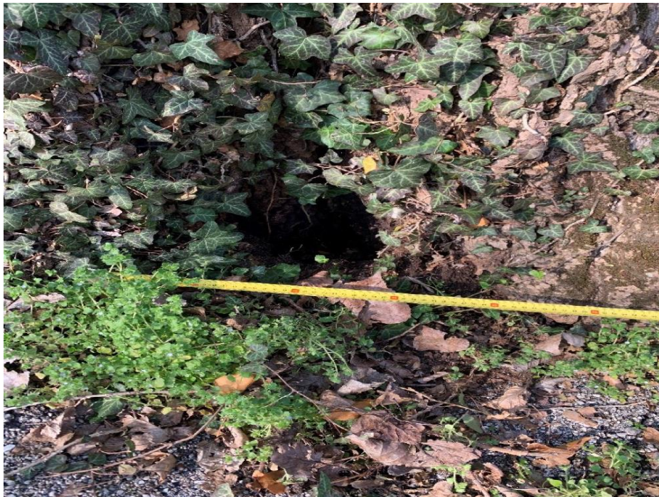
Figura 4. Profonde cavità al colletto