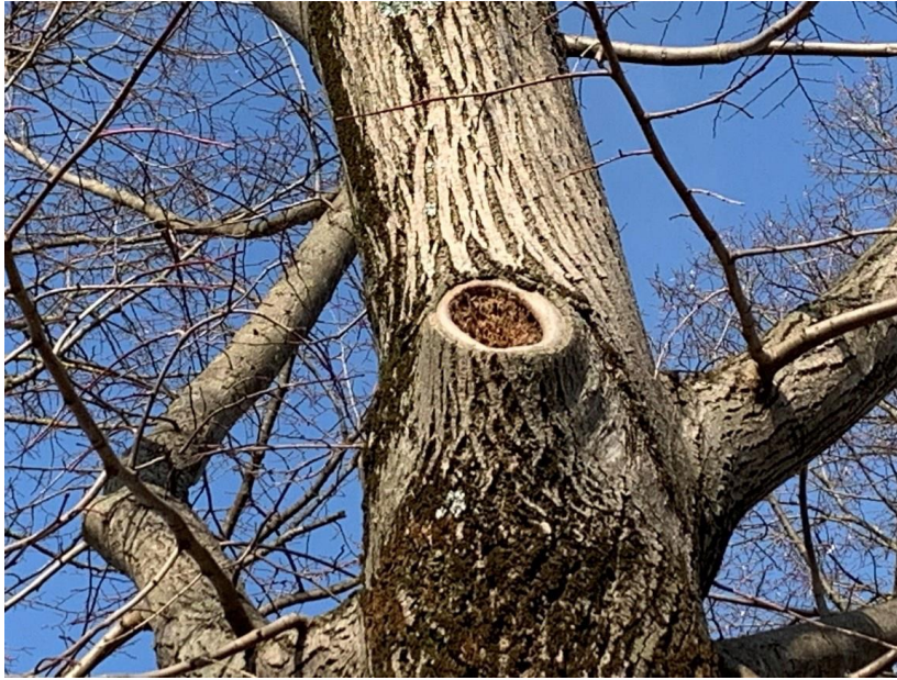
Figura 4. Ferite da errate potature mai rimarginate

Relazione tecnica generale – Perizia di Variante n.1