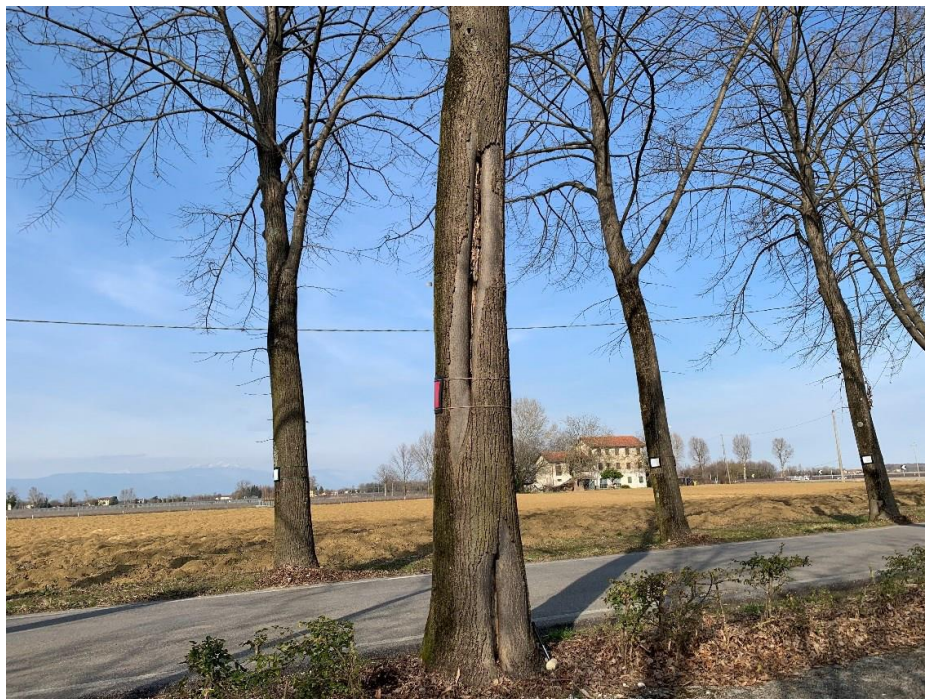
Figura 4. Ampie ferite longitudinali