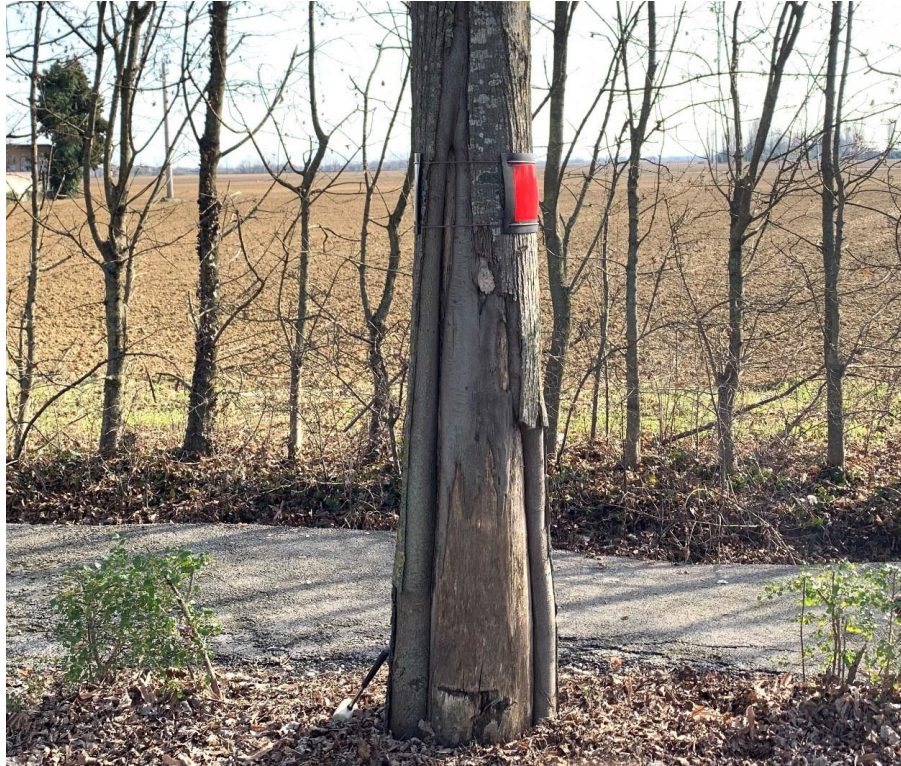
Figura 4. Grave lesione al colletto ed al fusto con legno degradato e marcescente

Relazione tecnica generale – Perizia di Variante n.1